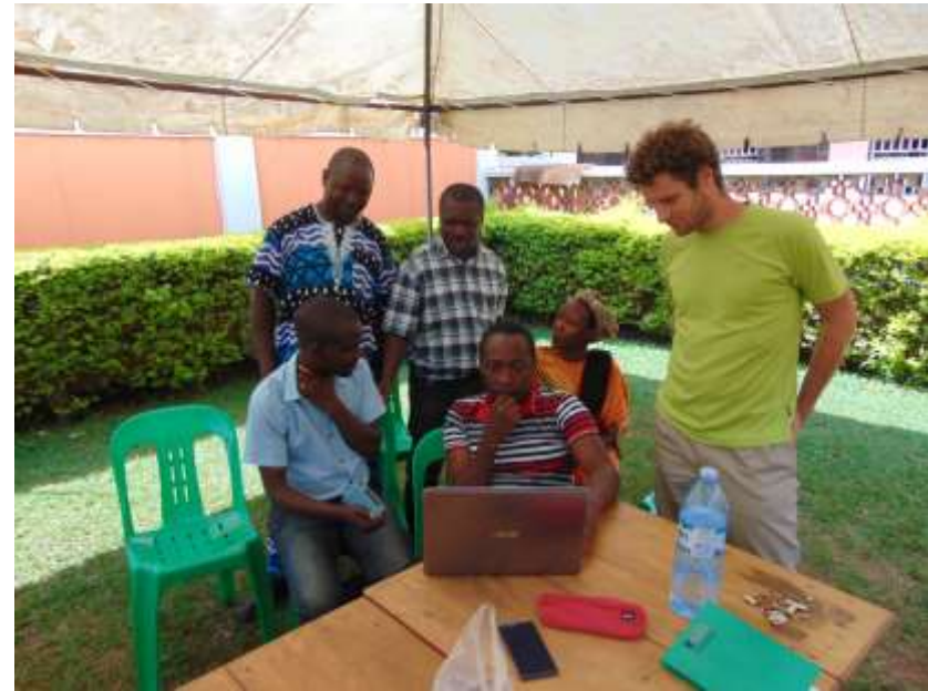
Equipe AMONT au Rungwe, au mont Elgon