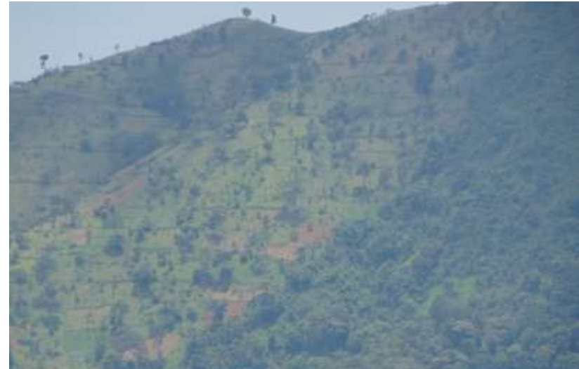
Empiètement champs/parc, Mt Elgon.

Comment se construisent des systèmes de ressources dans un environnement facteur d'attractivité pour des acteurs plus variés et dont les avantages sont remis en cause ?