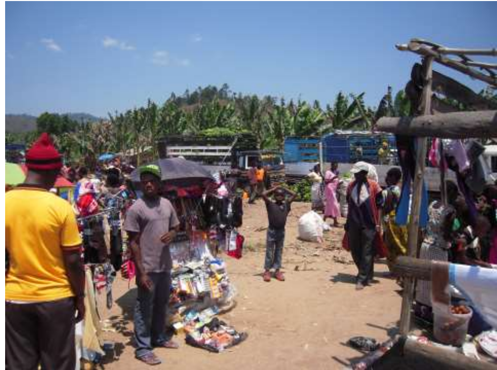
Marchés ruraux: carrefours de routes marchandes. Ibililo, Tzie (Racaud, 2018)

Avantages comparatifs de l'espace-ressource de montagne dépendent de l'intégration des espaces de montagne à des échelles et processus associés plus vastes.