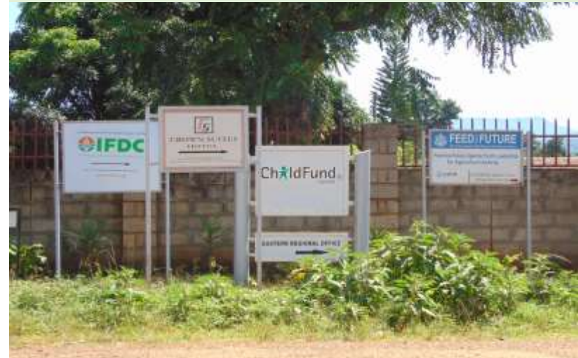
Présence de bailleurs-acteurs du développement, Mt Elgon (Racaud, 2018)