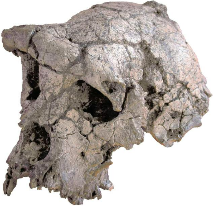
Crâne de Toumaï ( Sahelanthropus tchadensis )